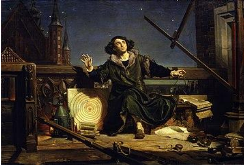
„Astronom Kopernik, czyli rozmowa z Bogiem” - Jan Matejko